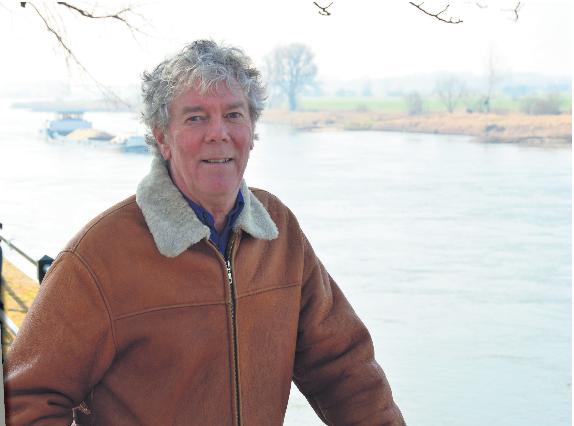
Auteur Hans Heesen.